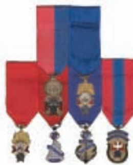
Diagramme 6 Ex-député d'état Ancien vice-maître suprême Ancien maître Ancien député de district Ex-grand chevalier Ex-fidèle navigateur