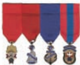
Diagramme 4 Ancien maître Ancien député de district Ex-grand chevalier Ex-fidèle navigateur