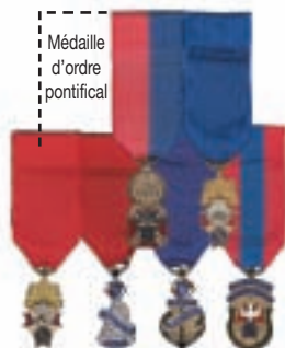
Diagramme 7 Médaille d'ordre pontificaux Ex-député d'état Ancien vice-maître suprême Ancien maître Ancien député de district Ex-grand chevalier Ex-fidèle navigateur