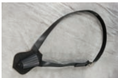
Harnais du porte drapeau