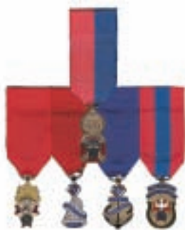
Diagramme 5 Ancien vice-maître suprême Ancien maître Ancien député de district Ex-grand chevalier Ex-fidèle navigateur