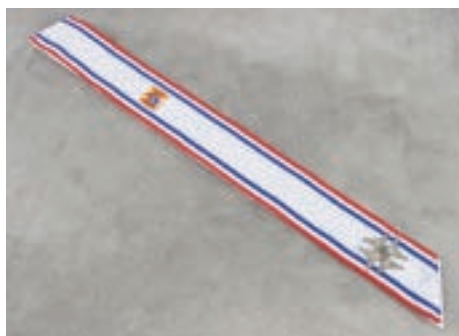
Baudrier de service