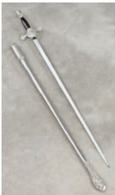
Épée à manche noir et fourreau