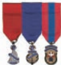
Diagramme 3 Ancien député de district Ex-grand chevalier Ex-fidèle navigateur