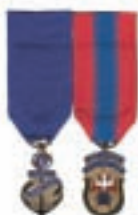
Diagramme 2 Ex-grand chevalier Ex-fidèle navigateur